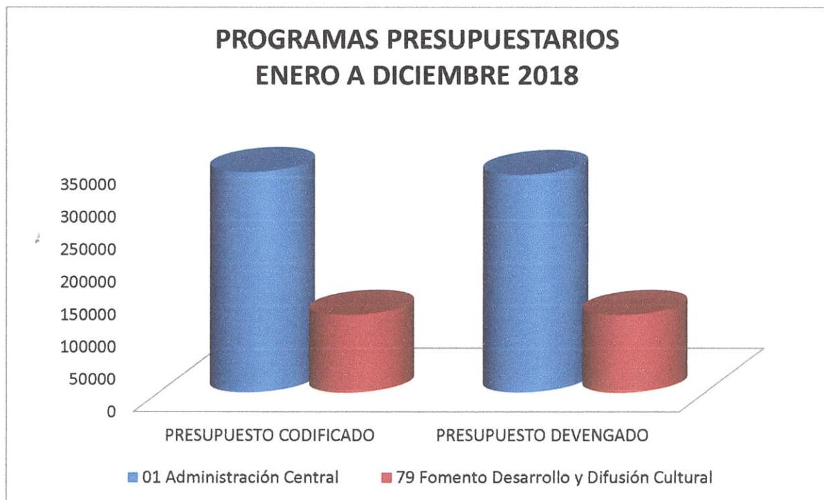
Grafico Nro. 1