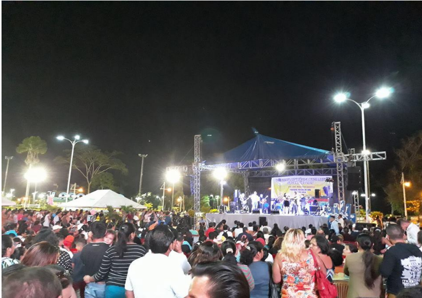
Participación con un jurado calificador y apoyo a los artistas participantes del cantón Francisco de Orellana, en el I Festival de Música Nacional Sucumbíos 2017. 02/Sep