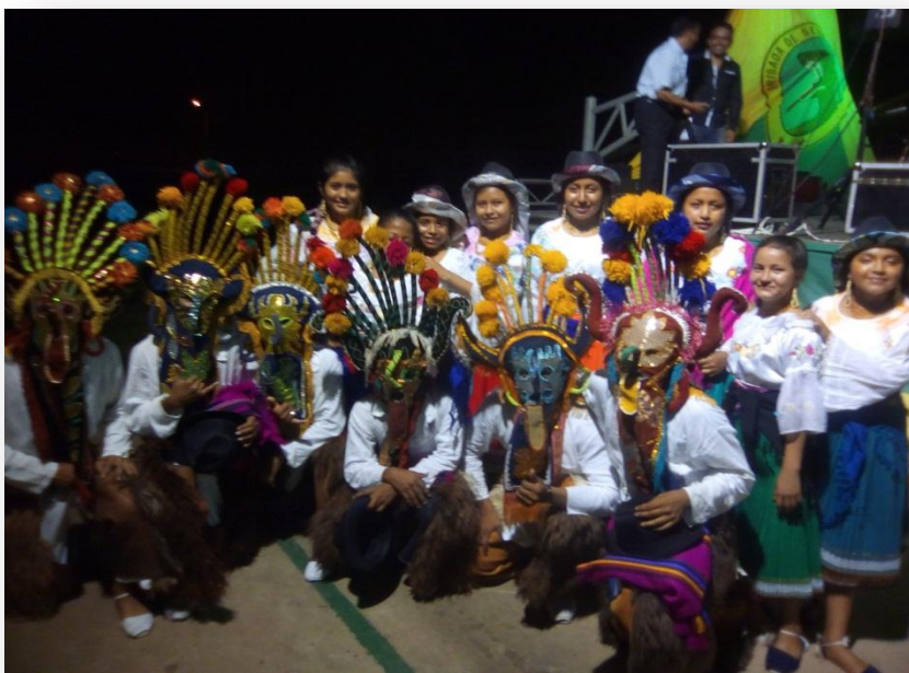
Grupo de Danza Bonanza. Espacio físico para los ensayos.