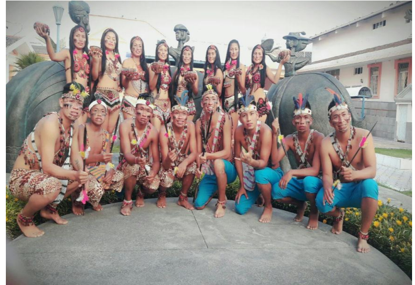
Participación del grupo de danza "Amawta Tushuy", en los 50 Años de Vida Institucional del Grupo de Danzas Folklóricas "Ñucanchi Llacta". 19/Sep