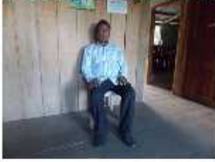
NACE EN LORETO EL 05 DE NOVIEMBRE DE 1954