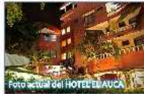
Foto actual del HOTEL EL AUCA