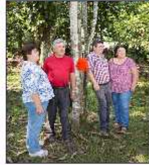
"Integramos una familia que nos enseñó a vivir en una tierra que nos consideró hijos y heredita."