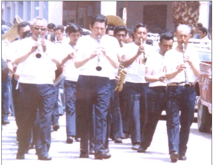
Banda Municipal en las fiestas del Carnaval de Guaranda 1965

En este año la Banda acompaña a la selección de fútbol de Bolívar al cantón Machachi, donde se realizaba el Campeonato Nacional de Fútbol y en el partido Bolívar versus Pichincha, en el que como costumbre la Banda de Guaranda amenizaba este encuentro y estando animando a su selección con el tradicional Carnaval de Guaranda la gente asistente comenzó a jugar con la cerveza, formándose una gran fiesta de los hinchas en los graderíos del estadio, mientras que los bolivarenses gritaban ¡viva Guaranda!.