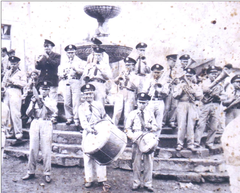
Banda de Músicos Municipal de la Ciudad de Guaranda del año 1945, Ubicada en la pila de piedra de la Plaza 15 de Mayo, donde se realizaban corridas de toros