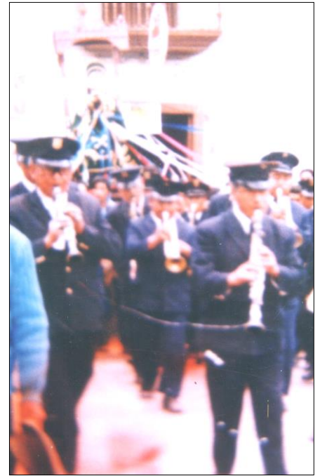
Banda Municipal en las fiestas de San Pedro 1970