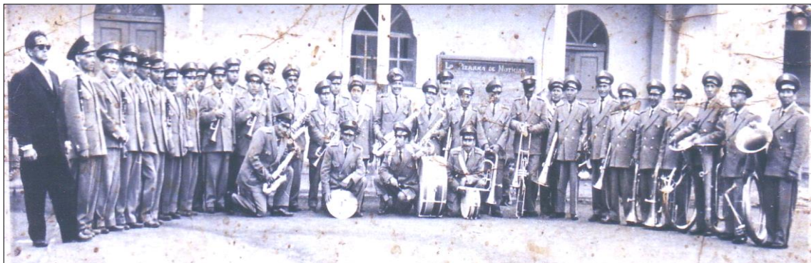
Banda Municipal de la Ciudad de Guaranda del año 1965