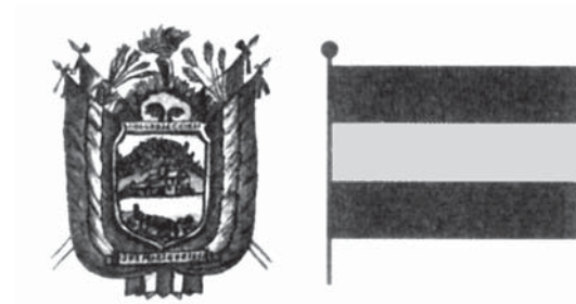
Escudo y Bandera del cantón Chimbo