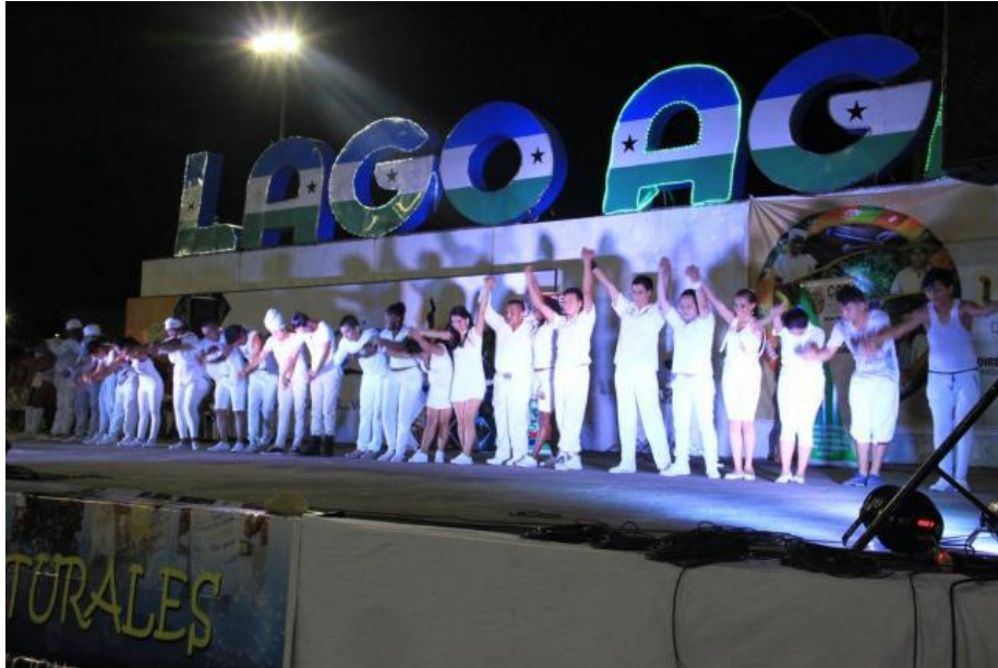
Taller de Expresión corporal y danza, a jóvenes de grupo de danza del cantón Putumayo