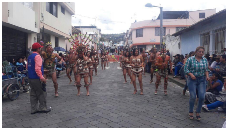
Participación Caravana Cultural, en el Barrio 26 de Junio, por motivo de las fiestas de aniversario.