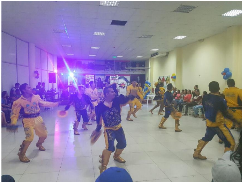
Participación de la CCE-NS, con un grupo de zanqueros, con motivo de las fiestas de aniversario Participación del grupo de Danza de la CCE-NS en las fiestas de Corpus Christi por aniversario del cantón Pujilí