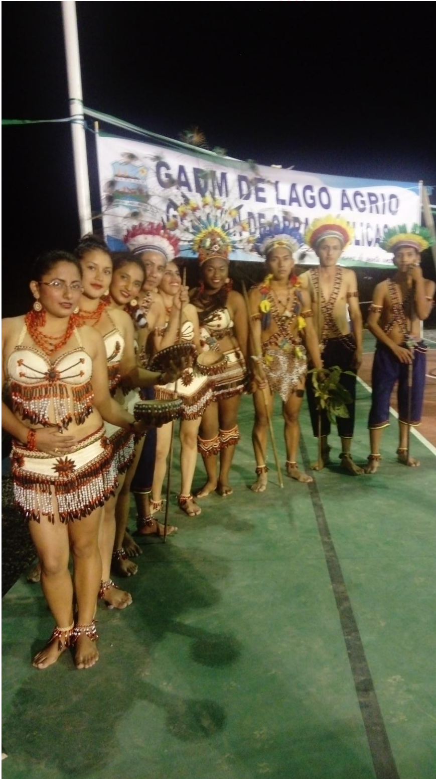
Capacitación en danza y pintura a niños y niñas de la Parroquia con motivo de distracción en actividades que desarrollen intelectos artísticos