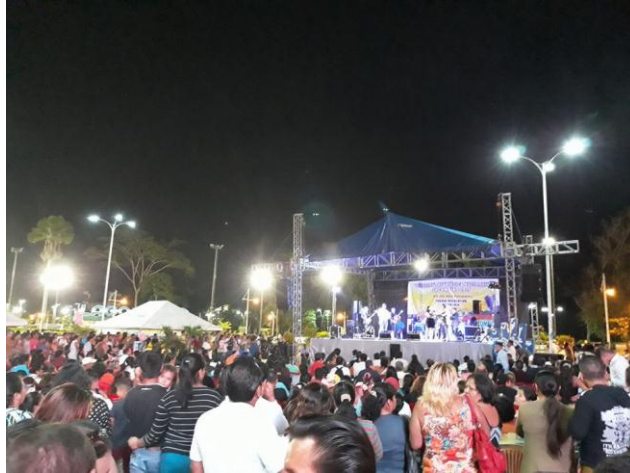
Participación del grupo de Danza de la CCE-NS en el 5to Festival Internacional y el 8vo Festival Nacional de Danzas Folklóricas "San Rafael 2017"