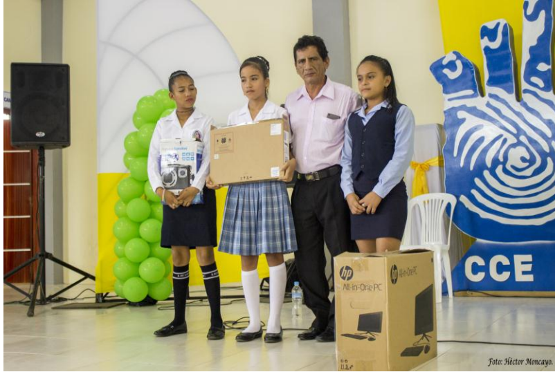
Participación del grupo de Danza de la CCE-NS en el II Concurso Regional de Danza