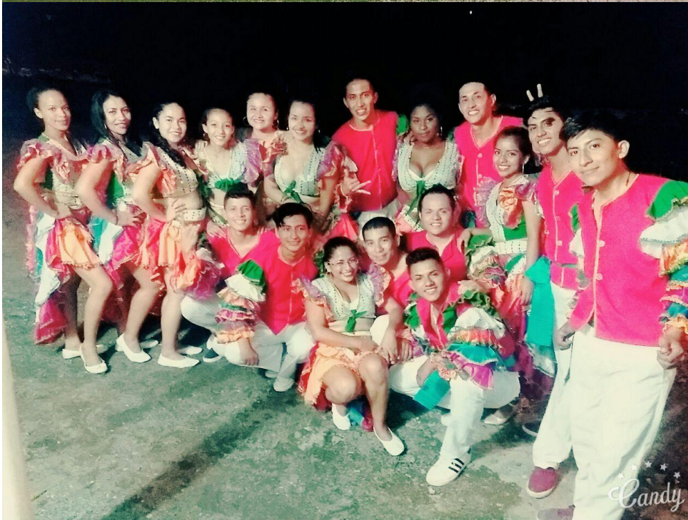
Presentación grupo de danza de la CCE-NS, en fiestas de aniversario del Barrio 23 de Noviembre