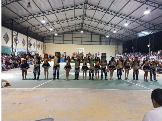
Participación con artista musical en las fiestas de aniversario del Recinto Amazonas.

Desarrollo de Concierto Musical "Mayu Cultural Rock 2017", dentro de las festividades de carnaval, en las pirámides de Max