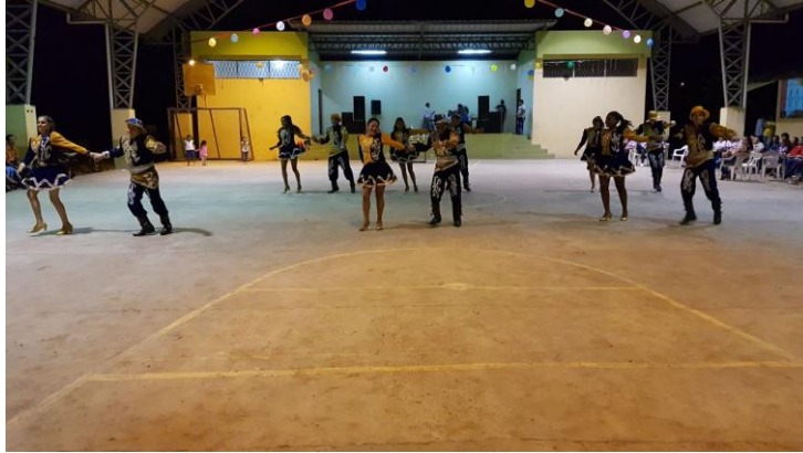
Desarrollo de evento artístico de expresión cultural denominado JUNGLA ROCK SOMOS CULTURA, en plaza cívica.