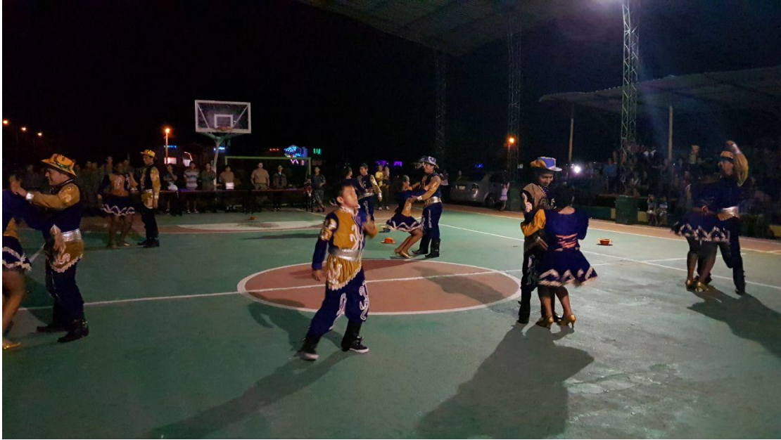
Caravana artística con artistas musicales y escénico en fiestas navideñas con estudiantes de la Unidad del Milenio Lumbaqui