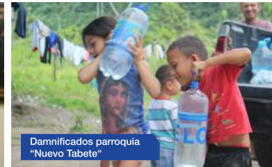
Dañificados parroquia "Nuevo Tabete"