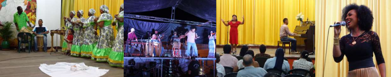
Diversas Presentaciones de Grupos Folkloricos y Cantantes