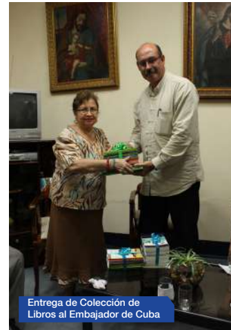
Entrega de Colección de Libros al Embajador de Cuba

Se han recibido volúmenes de libros, enciclopedias, libros sueltos, donados por manos generosas que coadyuvan al desarrollo y emprendimiento de la lectura de parte de los usuarios.