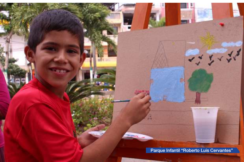
Parque Infantil "Roberto Luis Cervantes"