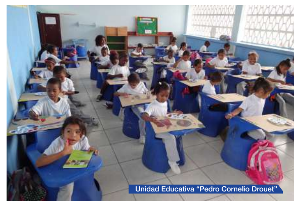
Unidad Educativa "Pedro Cornelio Drouet"