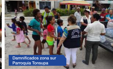
Dañificados zona sur Parroquia Tonsupa