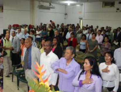
Actos realizados en el Salón Auditorio “Nelson Estupiñán Bass”