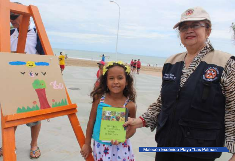
Malecón Escénico Playa "Las Palmas"