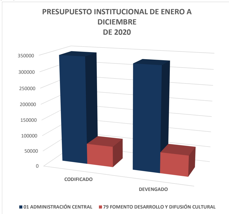
Grafico Nro. 1