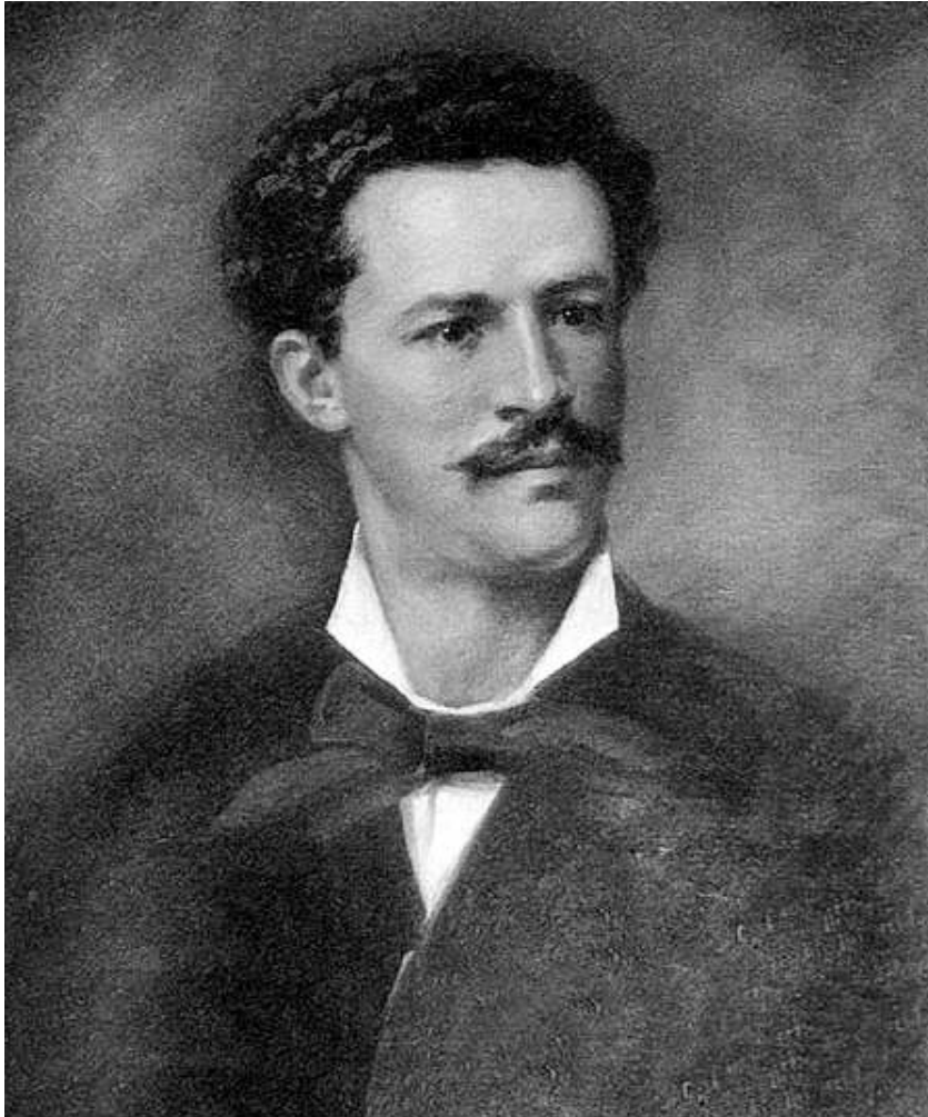
Óleo del escritor Juan Montalvo Fiallos

Fue desterrado a Ipiales, y en 1882 a París, en donde murió el 17 de enero de 1889, en la casa N° 26, de la Rue Cardinet, vestido de frac, pidió flores, muchas flores para su cadáver. ¿Y donde podía estar rodeado de muchas flores? en su amada ciudad de Ambato. Sus últimas palabras fueron: “Don Simón... Don Simón Bolívar... aramos en el mar”.