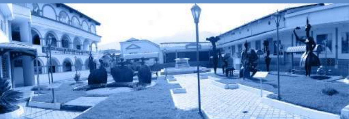
Plazoleta de la interculturalidad CCE, Imbabura