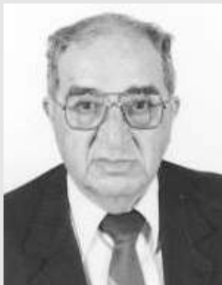
Jorge Isaac Cazorla

“El artista tiñó el manto azul y la veste de armiño de la Inmaculada en los colores de la aurora”