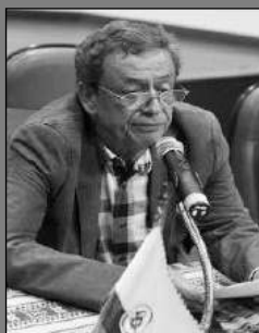
René Báez Centro de Pensamiento Crítico