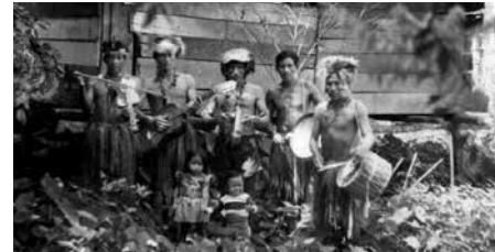
FOTO 15. Grupo Los Amazónicos.