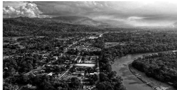
FOTO 21. Río Anzu.

Ríos pequeños: el Pibi, Chukapi, Yurakyaku, Juniak, Tsatsayaku, Shichuyaku, Chumbiyaku, Poroto, Piatúa Blanco, Piatúa Shikito, Pioculín, Pumayaku, Lagarto, Wayusa (Apuya), Pinlloyaku, Kutuna chico, Rosario Yaku, el Piwi, Ayupi (mapa 4).