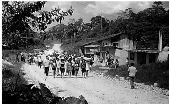
FOTO 4. Desfile de la población por la cantonización de Arosemena Tola)