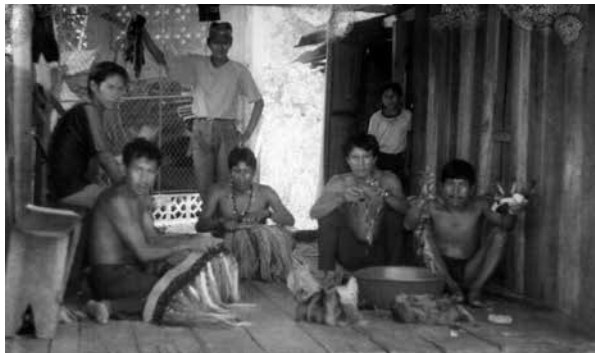
FOTO 1. Primeros pobladores de la colonia 'Velasco Ibarra'.