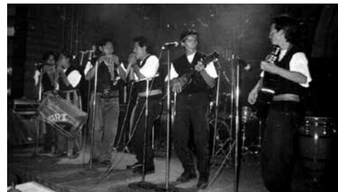
Foto 16. Grupo Almayari.