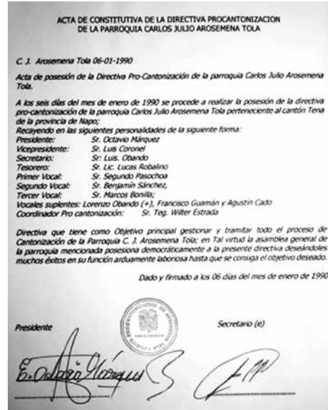
FOTO 14. Acta de constitución de la directiva procantonización.