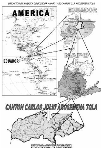
MAPA 1. Ubicación de Arosemena Tola en América, Ecuador y Napo.