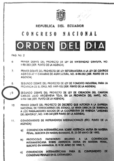
Foto 18. Orden del Día del Congreso Nacional para el segundo debate del proyecto de cantonización de Carlos Julio Arosemena Tola.